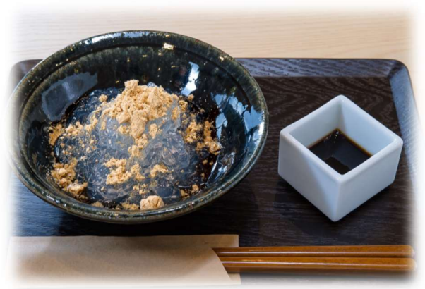
自家製ところてん (黒豆きな粉と黒蜜orゆずポン酢) 450yen