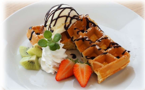
ワッフルアイスバニラ