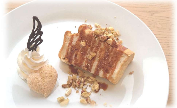
白いシフォンケーキ (キャラメルナッツ)