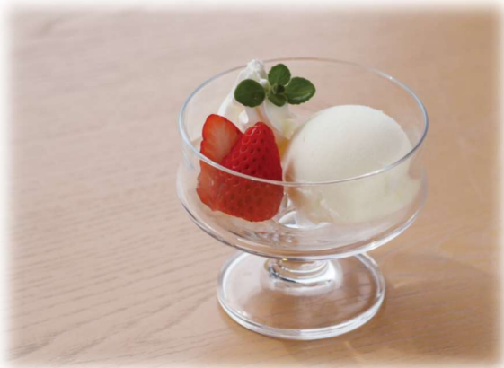
丹後ジャージー アイスクリーム 600yen