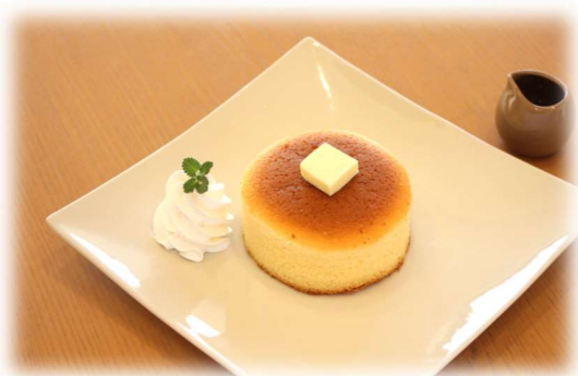
パンケーキ シングル