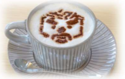
↑ 玄さんカフェラテ