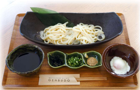
玄武洞冷やしうどん 温泉卵付き 950yen