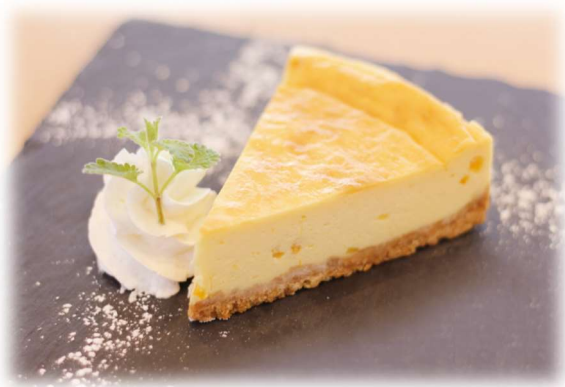
ベイクドチーズケーキ