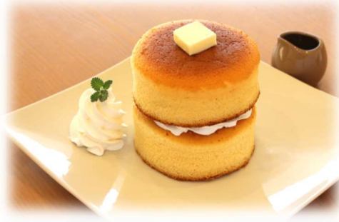
パンケーキ ダブル 990yen