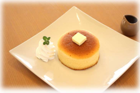
パンケーキ シングル 660yen