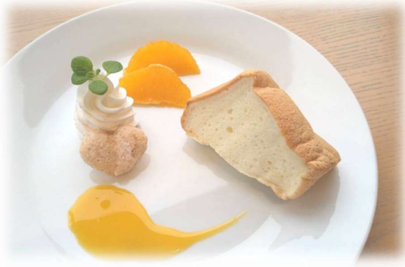
白いシフォンケーキ (みかんソース)