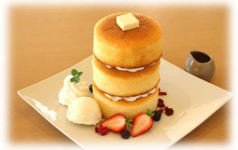
パンケーキ トリプル (バニラアイス・フルーツ付き) 1.500yen