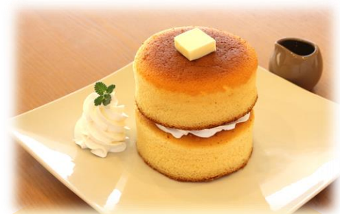
パンケーキ ダブル