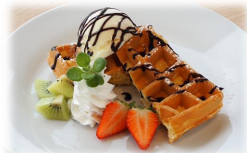
ワッフルアイスバニラ