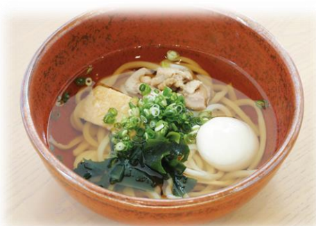
玄武洞あったかうどん 但馬鶏のせ 980yen