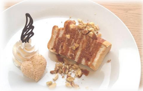
白いシフォンケーキ (キャラメルナッツ)