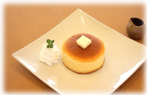
パンケーキ シングル