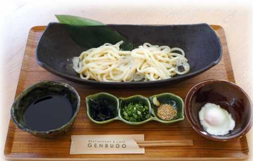
玄武洞冷やしうどん 温泉卵付き 950yen