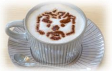
↑ 玄さんカフェラテ