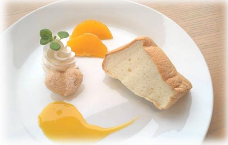
白いシフォンケーキ (みかんソース)