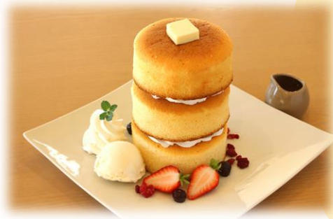
パンケーキ トリプル