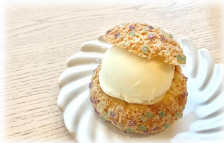
宝石シューアイス