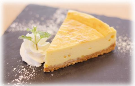
ベイクドチーズケーキ