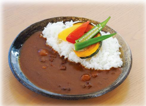
ビーフカレー 1,100yen 温泉卵トッピング +140yen サラダセット +180yen ご飯大盛り +70yen ※カレールーの大盛りは出来ません。