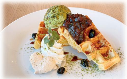
ワッフルアイス抹茶